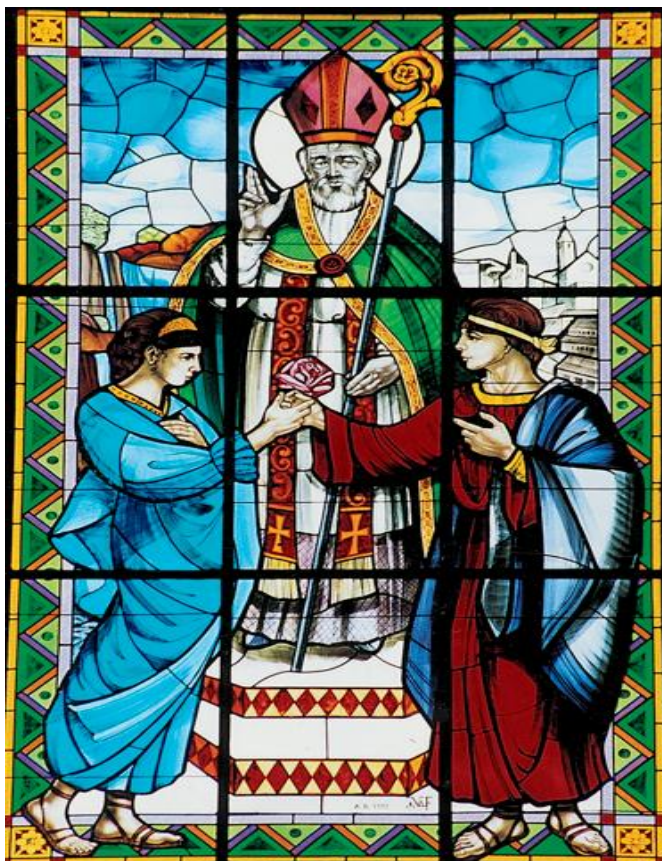
Fensterbild der Basilika Terni: Hl. Valentin, Schutzpatron der Liebenden

Samstag, 31. Januar bis Sonntag, 01. März