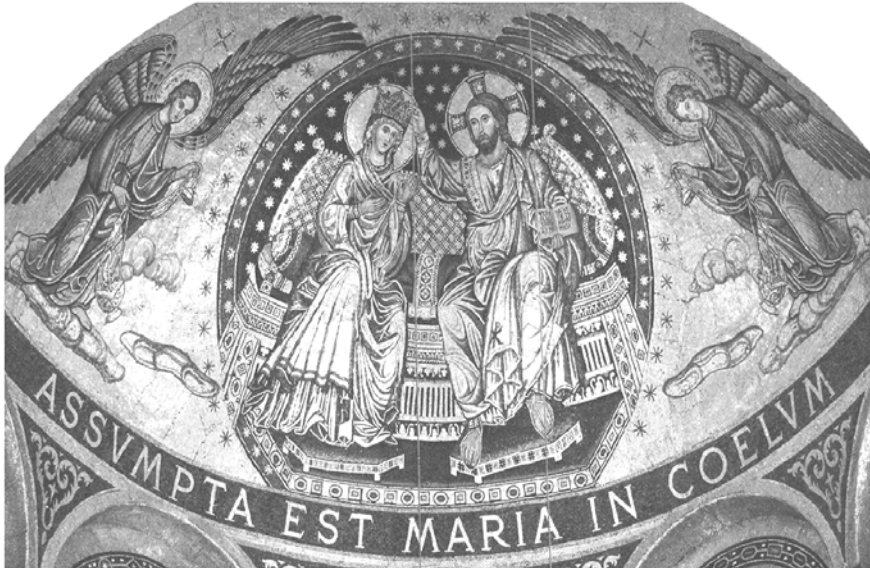
Dom St. Marien, Hamburg

Aufgenommen ist Maria in den Himmel; es freut sich die Schar der Engel. Alleluja!